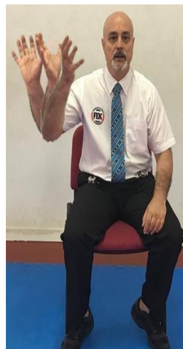
SE GIRA, NO MIRA TÉCNICA