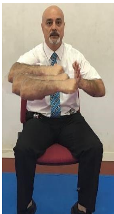
EXCESO DE CONTACTO