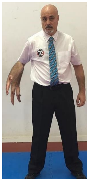
PRIMERA - SALIDA (EXIT)