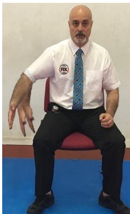
SALIDA - EXIT