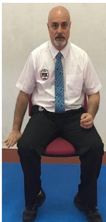
TÉCNICA POR DEBAJO DE LA CADERA