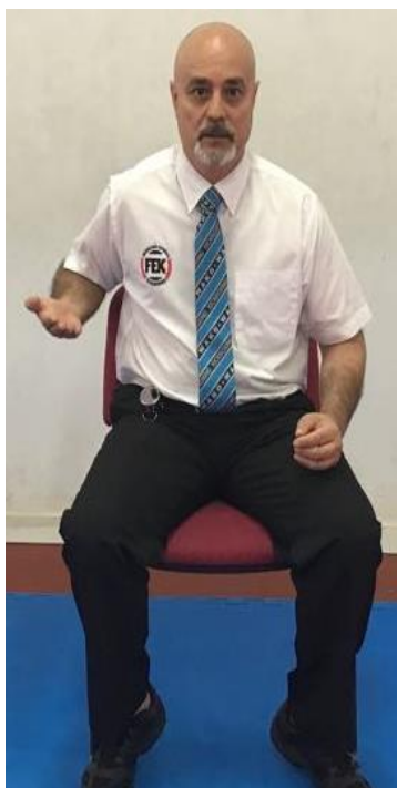
TÉCNICA POR ENCIMA DE LA CADERA